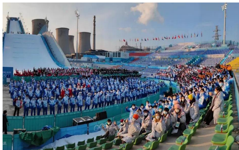
北京 2022 年冬奥会期间,548 名北理工师生承担志愿服务工作。