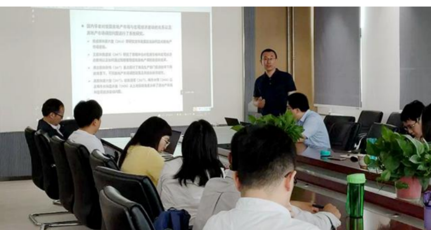
2021年9月,社会科学研究中心召开学术研讨会。