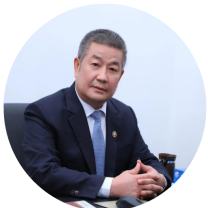
赵长禄 全国政协委员、北京理工大学党委书记

【编者按】3月10日,中国人民政治协商会议第十三届全国委员会第五次会议闭幕。3月11日,第十三届全国人民代表大会第五次会议闭幕。两会召开期间,北京理工大学党委书记赵长禄、光电学院教授王涌天、人文与社会科学学院院长李健作为第十三届全国政协委员,参政议政、建言献策,发出“北理工声音”。