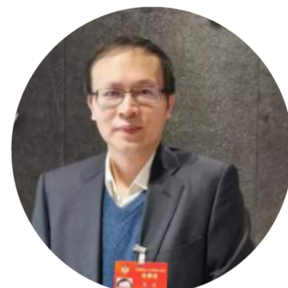
李健 全国政协委员、北京理工大学人文与社会科学学院院长